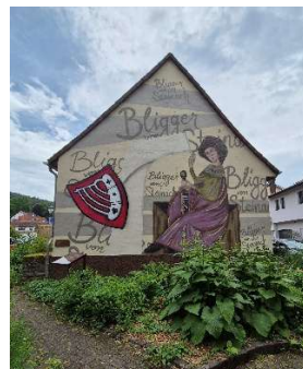
der Bligger (Minnesänger) von Steinach