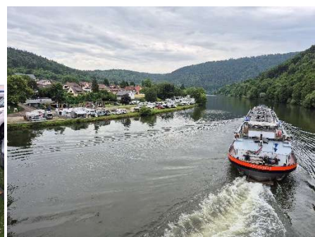
Eines der zahlreichen Schiffe auf dem Neckar

Ein Apéro zur Feier der WoMo-Beklebungen und ein weiteres, hervorragendes Clubessen bilden den Rahmen für das gesellige Beisammensein und viele wohltuende Gespräche.