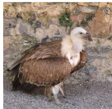
Gänsegeier im Gehege