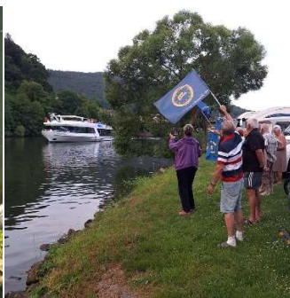
Begeisterung über das Party-Schiff