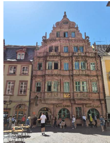
Fassade des Hotel zum Ritter

Vor dem Abschiedessen im Biergarten des Campingplatzes nutzen wir das hochsommerliche Wetter für einen Ausflug mit dem Fahrrad in die nahegelegene Vierburgenstadt Neckarsteinach.