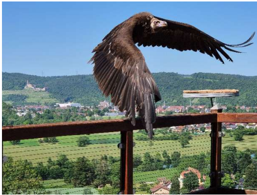
Flugeleganz / Burg Hornberg im Hintergrund

Eine Stunde lang entzücken die eleganten Raubtiere die Zuschauer mit ihren Flugkünsten, bereichert durch interessante Informationen der vorführenden Personen.