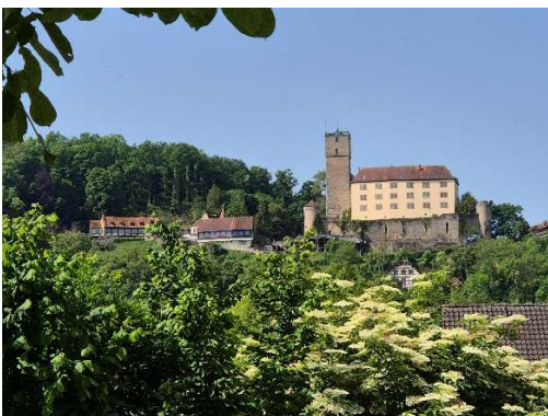
Blick auf die Burg Guttenberg

Am letzten Tag in Neckarzimmern besuchen wir die nahe gelegene Burg Guttenberg . Nebst der nie zerstörten Staufferburg sind die verschiedenen Raubvögel der Anziehungspunkt dieser seit dem 15. Jahrhundert von den Freiherren von Gemmingen bewohnten Burg.