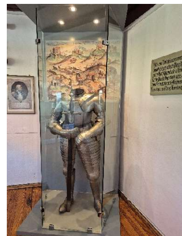
Ritterrüstung vor historischen Gemälden

Am nächsten Tag folgt ein weiteres Highlight: Die Besichtigung von Bad Wimpfen , die auch schon als schönste Stadt Deutschlands erkoren wurde.