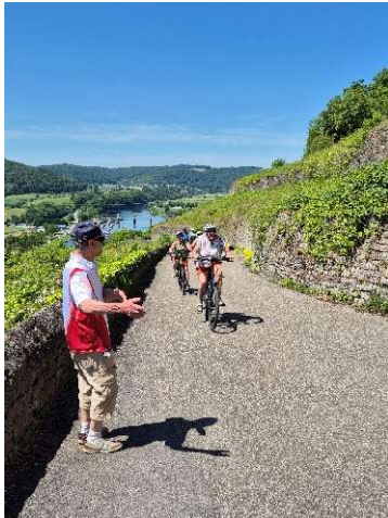
Zu Fuss oder mit dem Fahrrad ...

Von hier aus wird die nahegelegene Burg Hornberg mit dem Fahrrad oder zu Fuss besucht. Hier hat u. a. auch der Ritter Götz von Berlichingen residiert. Eine interessante Führung bringt uns das Leben auf den Burgen im Mittelalter wieder näher.