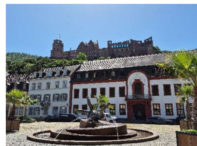
Sebastian-Münster-Brunnen vor der Schlossruine Heidelberg