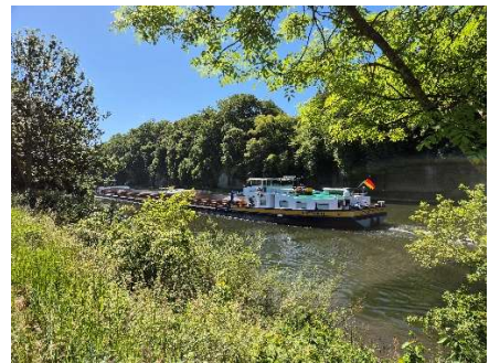
Schiffsverkehr auf dem Neckar