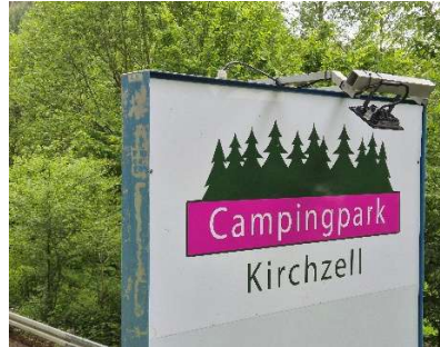
Umgeben vom Odenwald: Campingpark Kirchzell