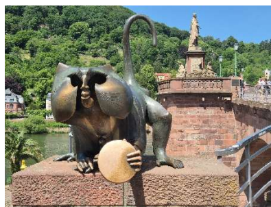
Der alte Affe mit Spiegel unter seinesgleichen