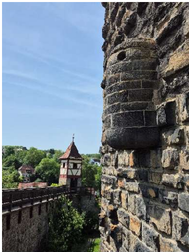
Plumpsklo am Roten Turm