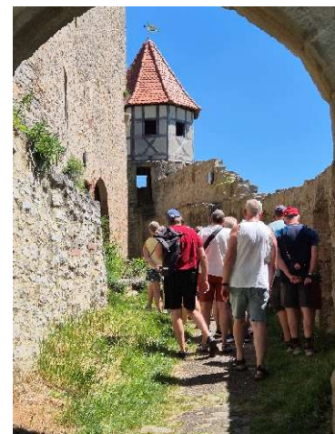
Im Zwinger zum Gefängnisturm