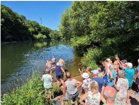
Abkühlung mit Bewunderung

Am Nachmittag besuchen einzelne den Trödelmarkt im nahe gelegenen Neckarelz. Der Radweg führt durch blühende Wiesen und grüne Felder.