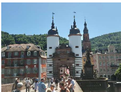
Die Alte Brücke mit dem Brückentor

Am 29. Mai fahren wir auf dem Neckar-Radweg in die Universitätsstadt Heidelberg . Bei sommerlich heissen Temperaturen schlendern wir durch die malerischen Gassen und kehren in gemütlichen Cafés oder in der Mensa der Uni ein.