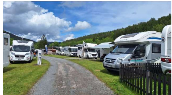
Viel Platz, rundum Natur, viel Ruhe, ebenes Gelände ... was willst du mehr?

Am nächsten Tag geht's in die historische Fürstenresidenz Amorbach . Einige benutzen das Fahrrad, die andern führt ein Privatbus vom Friedhof Kirchzell nach Amorbach und zurück zum Campingplatz.