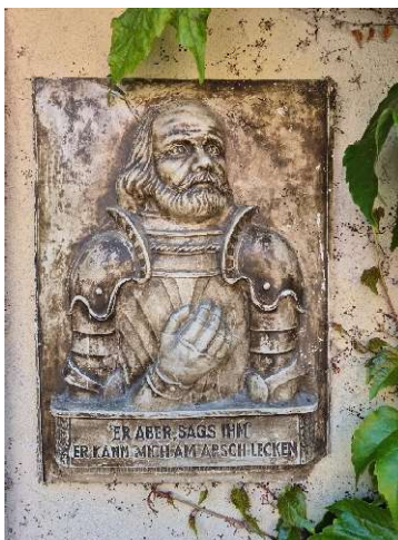
Ein Spruch von Götz ... / Göthe