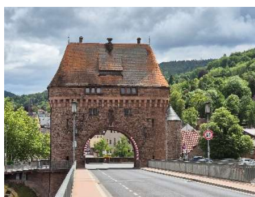
Von der Mainbrücke: Blick auf den Brückenturm und auf das Mainufer