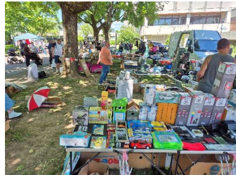
Trödelmarkt in Neckarelz

Am letzten Tag in Neckarzimmern besuchen wir die nahe gelegene Burg Guttenberg . Nebst der nie zerstörten Staufferburg sind die verschiedenen Raubvögel der Anziehungspunkt dieser seit dem 15. Jahrhundert von den Freiherren von Gemmingen bewohnten Burg.