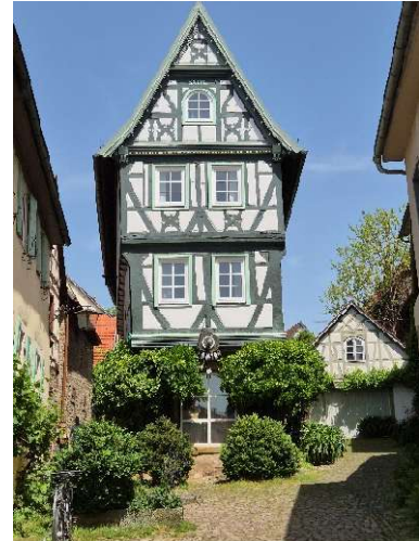
... ein weiteres Bijou

Der freie Tag wird genutzt, um die versprochene Mutprobe (3-Kampf im Neckar) vor grosser Fankulisse einzulösen.