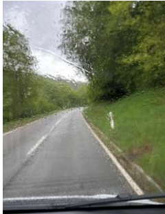
Wann wird es wieder richtig ... warm?

Am 14. Mai 2026 treffen die 32 RMF-Mitglieder und die 3 Gäste bei wechselhaftem Wetter auf dem von Wald umgebenen Campingpark in Kirchzell im Odenwald ein. Auf dem ruhigen, von Wald umgebenen Gelände findet jeder Teilnehmer seinen grosszügig bemessenen Platz.