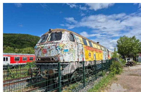
... Bahnhof in Amorbach