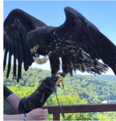
Ein Küken zur Belohnung

Am 27. Mai fahren die zwei Konvois zum letzten Campingplatz in Neckargemünd . Der Empfang ist äusserst freundlich und mit einer Kiste Bier auch unerwartet grosszügig. Auf dem grossräumigen und ruhigen Platz direkt am Neckar geniessen alle die Ruhe und Erholung. Viel Freude bereiten die Enten und Gänse mit ihren häufigen Besuchen in Begleitung ihrer putzigen Jungen.