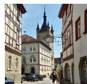
Blick auf den Blauen Turm