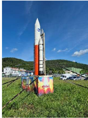
Mit der NASA auf den Mond