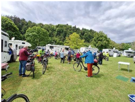
Bereit zur Fahrradtour

Am nächsten Tag radeln wir dem Neckar entlang flussab abwärts bis nach Eberbach.