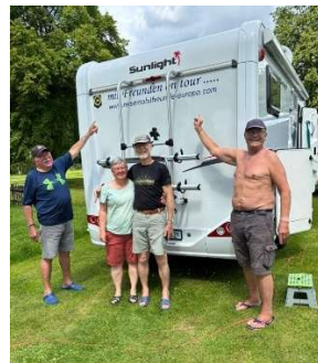
Mit Freunden on Tour ...