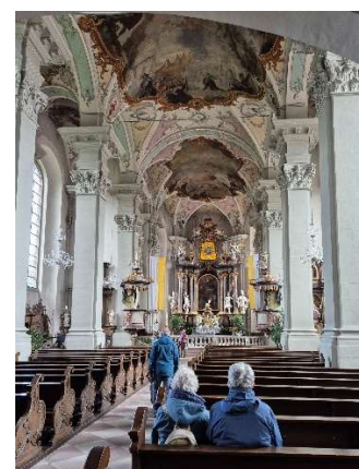
im prächtigen Rokoko-Stil