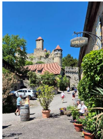
zur Burg Hornberg