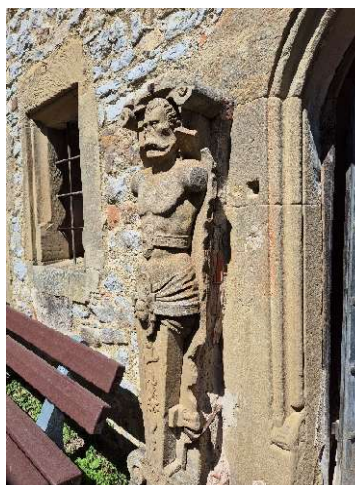
Böse Geister, bleibt draussen!