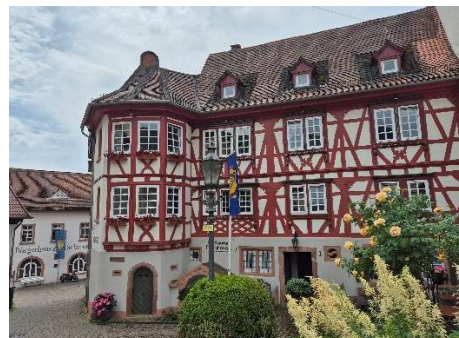
ein malerisches Fachwerkhaus

Am Sonntag, den 31. Mai geht die abwechslungsreiche Frühlings-Ausfahrt 2026 zu Ende. Nicht nur das Wetter (von nass-kalt bis zu hochsommerlich heiss), sondern auch die gesamte Reise hat viel Abwechslung und zahlreiche – auch ungeplante – Überraschungen geboten, die uns lange in Erinnerung bleiben werden.