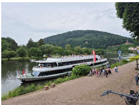
Anlegen in Neckarsteinach ...

Vor dem Abschiedessen im Biergarten des Campingplatzes nutzen wir das hochsommerliche Wetter für einen Ausflug mit dem Fahrrad in die nahegelegene Vierburgenstadt Neckarsteinach.