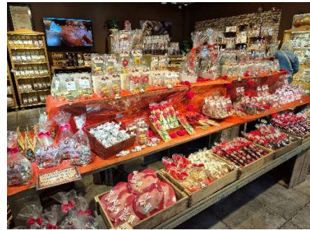
... etwas für jeden Geschmack.

Unser Marzipan fliegt am Mittwoch, den 13.05.2026 mit einer Rakete zur ISS und umrundet auf dieser die Erde!