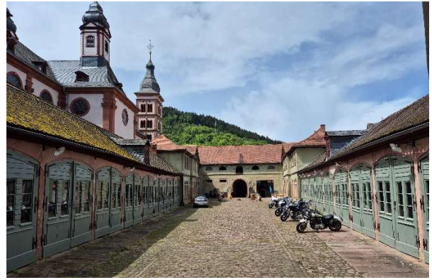
Rosstallungen im Fürstlich-Leiningschen Palais

Am 16. Mai findet die jährliche Mitgliederversammlung im Bistro Camper Treff statt. Der neu zusammengesetzte Vorstand führt zielgerichtet und informativ durch die Versammlung.