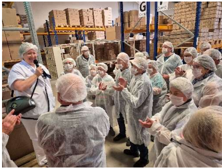
Führung durch die Marzipankonditorei

Bevor der nächste Standort angesteuert wird, besuchen wir die Odenwälder Marzipankonditorei in Weilbach bei Amorbach. Eine interessante Führung gibt uns den Einblick in die aufwändige Produktion der zahlreichen Marzipanprodukte, die noch mit viel Handarbeit hergestellt werden.