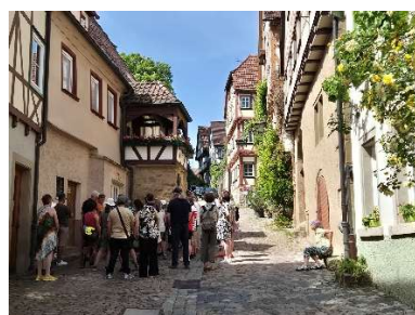
Führung vor dem Badhaus