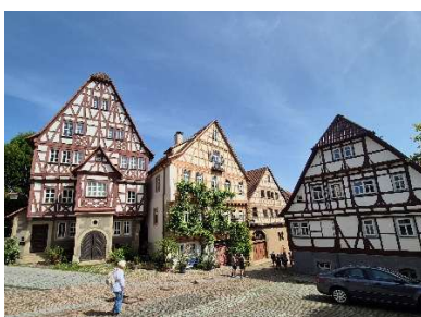
Gut erhaltene Fachwerkhäuser

Am nächsten Tag folgt ein weiteres Highlight: Die Besichtigung von Bad Wimpfen , die auch schon als schönste Stadt Deutschlands erkoren wurde.