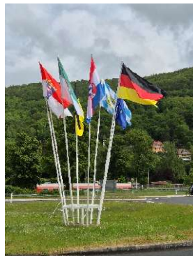
windiger Empfang am