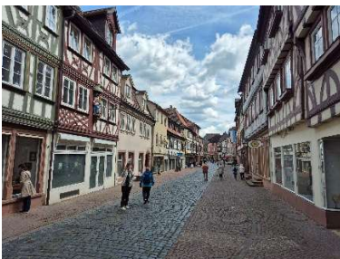
Die Flaniermeile in der Altstadt